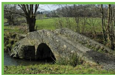
Le pont romain