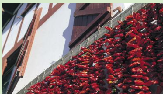
Piments séchant sur façade

Cet itinéraire qui fait le tour des producteurs fermiers, vous permettra d'acheter à domicile du piment d'Espelette ou du fromage de brebis.