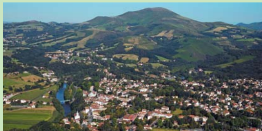
Cambo les Bains

P romenade agréable qui suit la Nive offrant un panorama sur les Pyrénées.