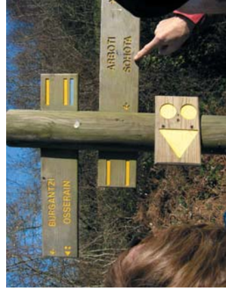
Une photo locale des sentiers ou balisage

: sentier très difficile, dénivelé de 300 à 800 m