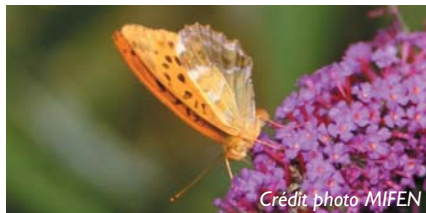
Cuvré commun sur l'arbre à papillon

Après la ferme Agorreta, poursuivre à gauche ⑦ N43°22.152W1°23.710. Franchir le passage à niveau. Suivre le balisage jusqu'à la Nive et retrouver le chemin du départ.